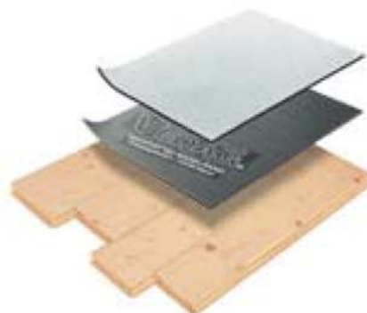
VEDAG ProfiDach Kaltdach auf Holz