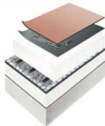
VEDAG SanierungsDach mit Zusatzdämmung